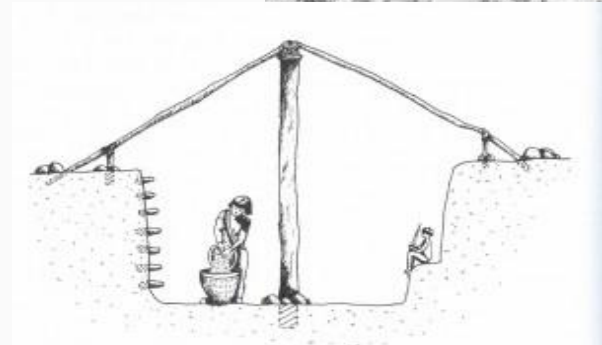
Figura 10. Casa subterrânea.